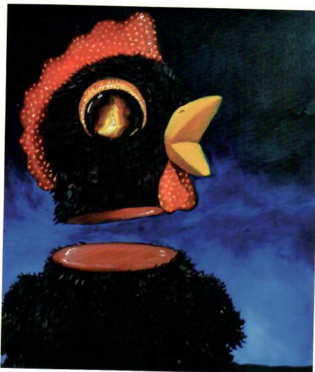
Oběť, olej na plátně, 60 × 70 cm, 2019

2019 Mostyn Open 2019, výstava finalistů Mostyn Prize, MOSTYN Gallery, Llandudno, Velká Británie 2019 YouAllDroveMeCrazy Vol. 2 Butterfly Effect, Karlovy Vary 2019 Girls, Girls, Girls..., Art & Event Gallery Černá labuť, Praha 2019 Výstava finalistů BBA Artist Prize 2019, BBA Gallery, Berlín, Německo 2019 From the Studio Floor, St. Barnabas Church, Cambridge, Velká Británie 2019 Art Prague, náměstí Republiky, Praha 2019 Pulp Fiction, Dudes&Barbies Gallery, Praha 2019 Tra figurativo e informale, Galleria Merlino, Florencie, Itálie 2018 Art Prague, Clam-Gallasův palác, Praha 2018 Art Safari, Studio Bubec, Praha 2018 Heart for Heart's Sake, Artery Gallery, Praha 2018 32/36, Kasárna Karlín, Praha 2018 Focus, Galerie Litera, Praha 2017 ATRIBUT, Jan Čejka Gallery / Galerie HYB4, Praha 2017 Art Prague 2017, Kafkův dům, Praha 2016 Žák, Honz, Sedlo, Wojnar, Galerie GAVU, Praha 2016 Přirozený svět, Pražský dům, Brusel, Belgie 2016 Art Prague, Kafkův dům, Praha 2016 Figurama 16, Katowice, Polsko 2014 Těsně vedle, Galerie Josefa Lieslera, Kadaň